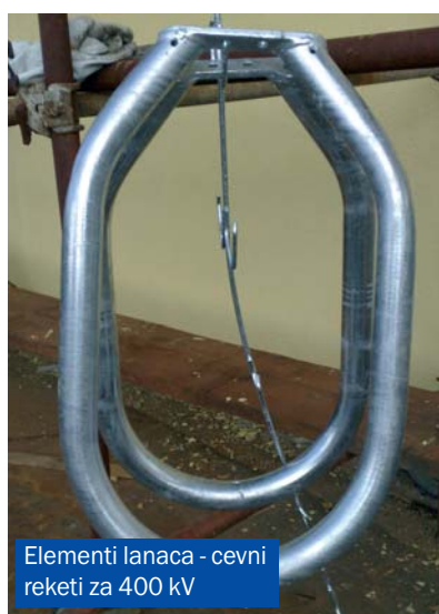
Elementi lanaca - cevni reketi za 400 kV