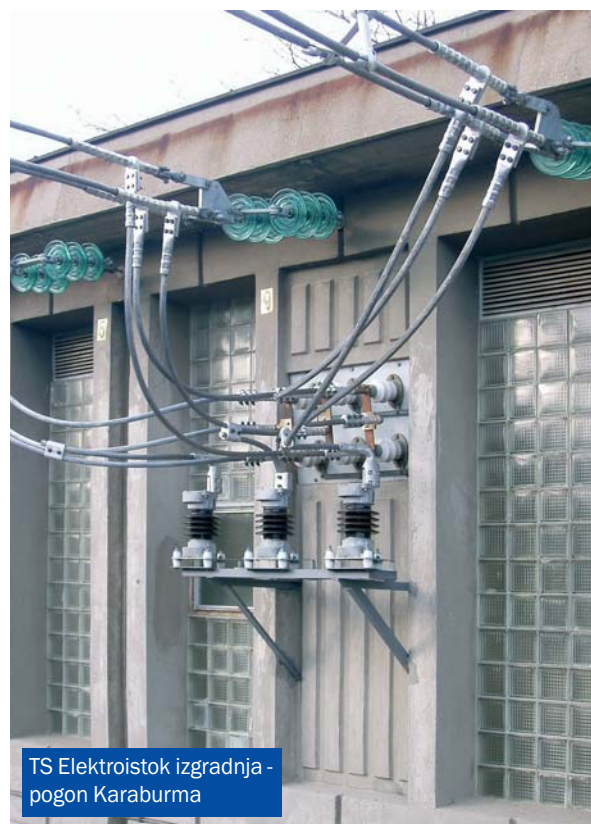
TS Elektroistok izgradnja - pogon Karaburma

Kontakt: NHBG - ŽIKS HARD D.O.O. Preduzeće za proizvodnju, inženjering i konsalting Vojvode Stepe 283 a, 11000 Beograd Telefon: 011/3971-632; 3098-019 Tel/Fax: 011/3971-632 E-mail: zikshard@sezampro.yu