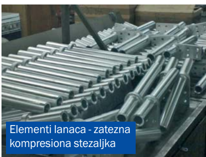
Elementi lanaca - zatezna kompresiona stezaljka