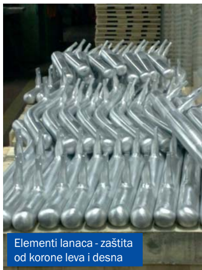
Elementi lanaca - zaštita od korone leva i desna