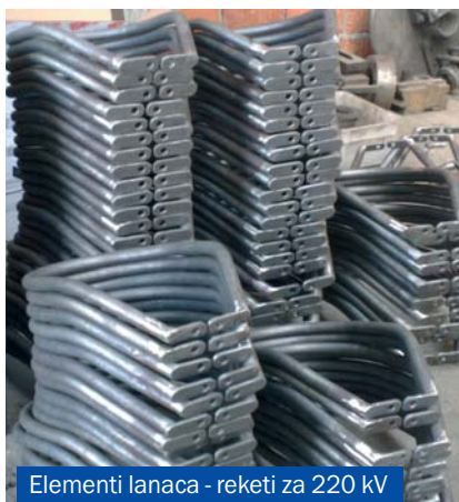
Elementi lanaca - reketi za 220 kV